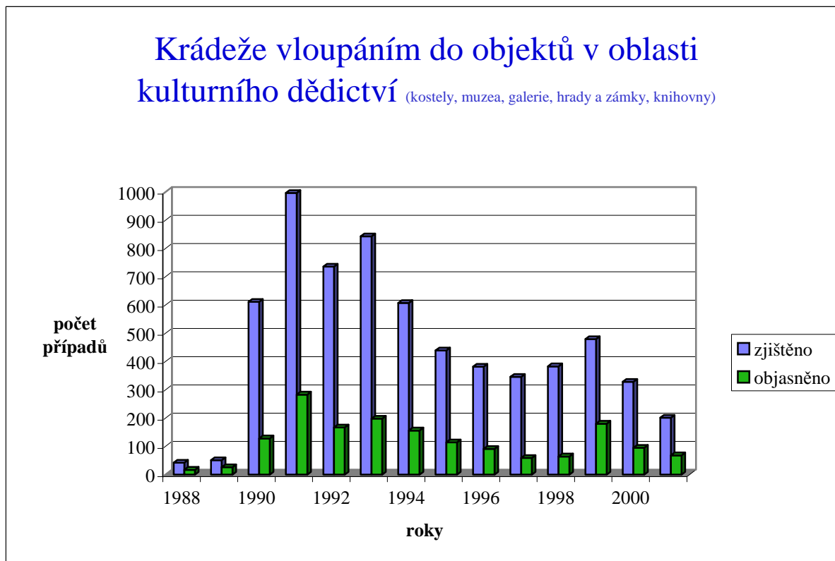
Graf č. 1